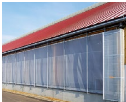
Krajové plachtové zakončení pro boční větrací systémy všech typů