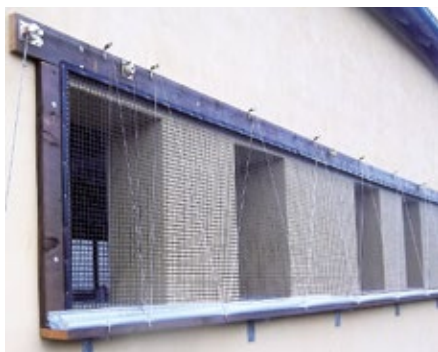
Výdřeva pro boční větrací systémy