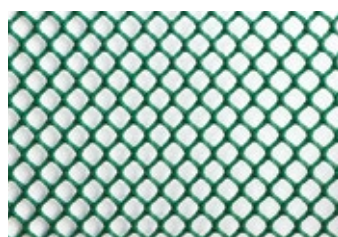
Sítě H07 černá/zelená

Jde o síť Netlon, která propouští 80 % vzduchu. Používá se jako podpůrná síť k bočním větracím systémům typu A. Rozměr: 2 x 35 m.