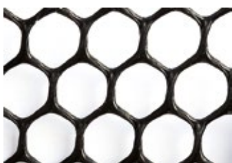
Sítě H12 černá

Jde o síť Netlon, která propouští 80 % vzduchu. Používá se jako podpůrná síť k bočním větracím systémům typu A. Rozměr: 2 x 35 m.