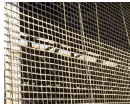
Pletiva a sítě